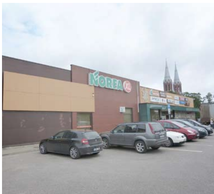
Anykščių Vilniaus gatvės „Norfa“ rugsėjį užvers duris rekonstrukcijai.

Vidmantas ŠMIGELSKAS vidmantas.s@anyksta.lt