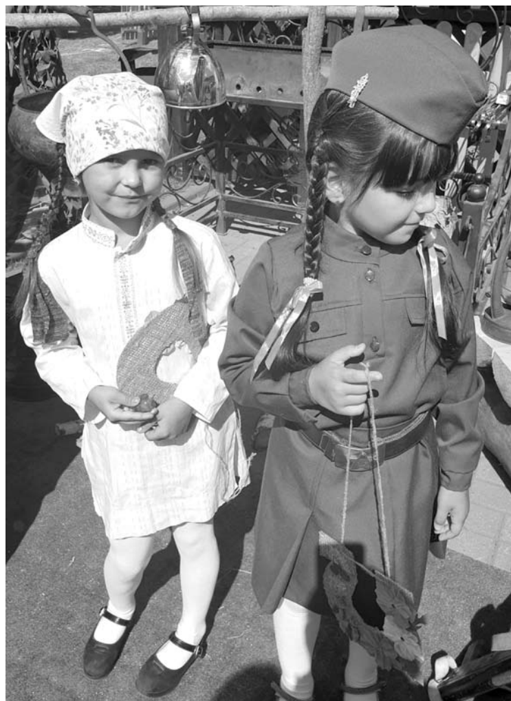
Vaikai karo metų drabužiais.