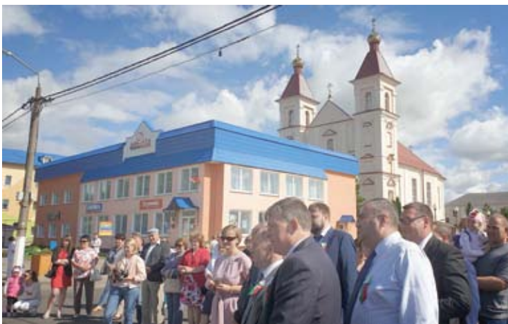
Klecko cerkvės kupolai buvo gerai užmaskuoti.