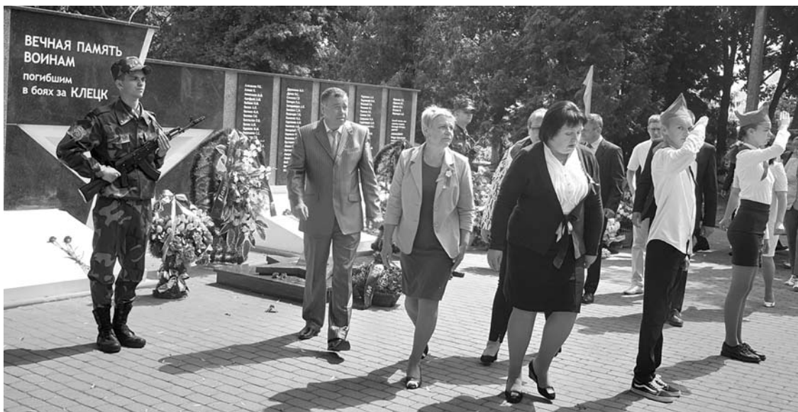
Prie amžinosios ugnies miestiečiai deda gėles. Budi kariai, saliuotuoja pionieriai.

Grazina ŠMIGELSKIENĖ grazina.s@anyksta.lt