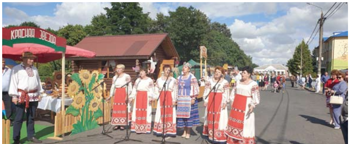
Viskas, kas baltarusiška, vienoje vietoje - pradėdant užrašu, baigiant saulėgrąžomis.