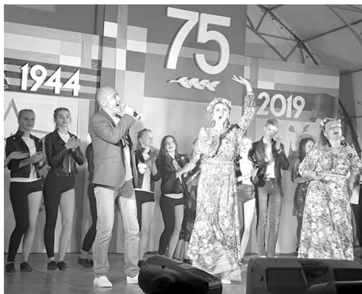
Šokiai, dainos, estrada.