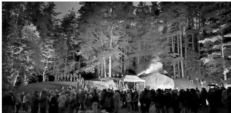
Paminėti 86 - ujų skrydžio per Atlantą metinių susirinko apie pora šimtų anykštėnų.

Liepos 16-osios vakare prie Puntuko akmenų, kaip ir kasmet, pora šimtų anykštėnų susirinko paminėti Stepono Dariaus ir Stasio Girėno 86-ąją skrydžio per Atlantą sukaktį.