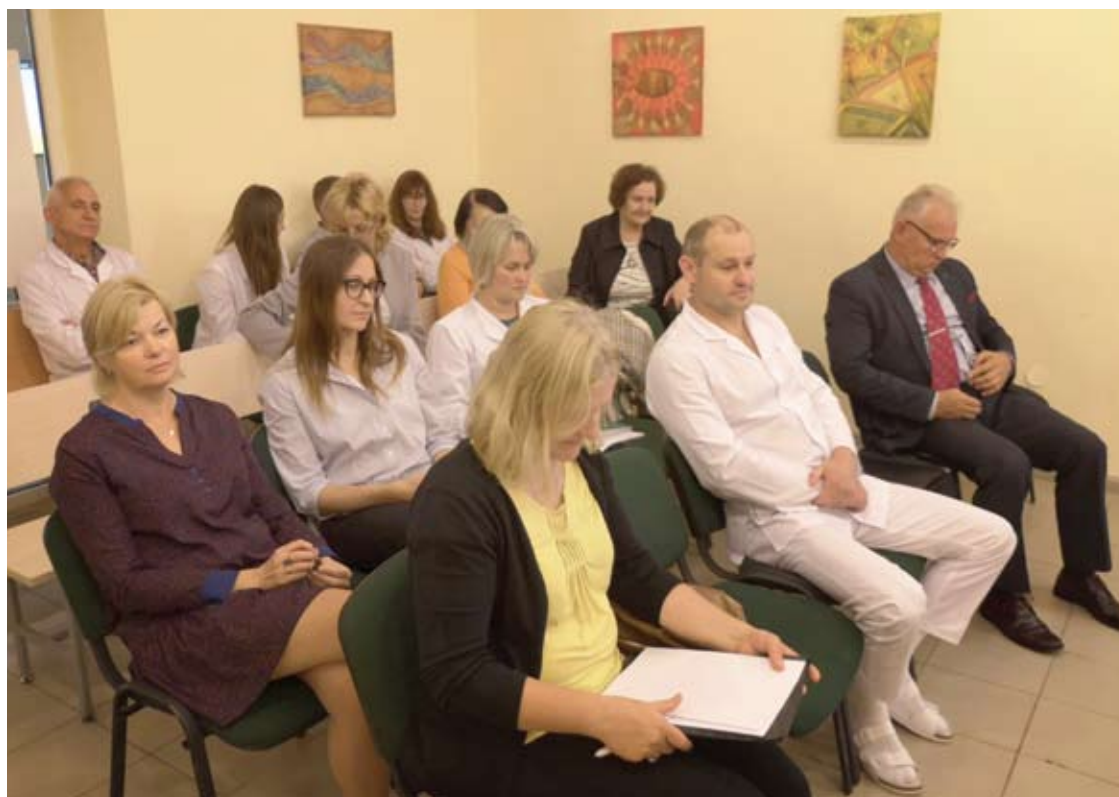
Didžioji dalis susitikime dalyvavusių medikų buvo tik klausytojai.

Robertas ALEKSIEJŪNAS robertas.a@anyksta.lt