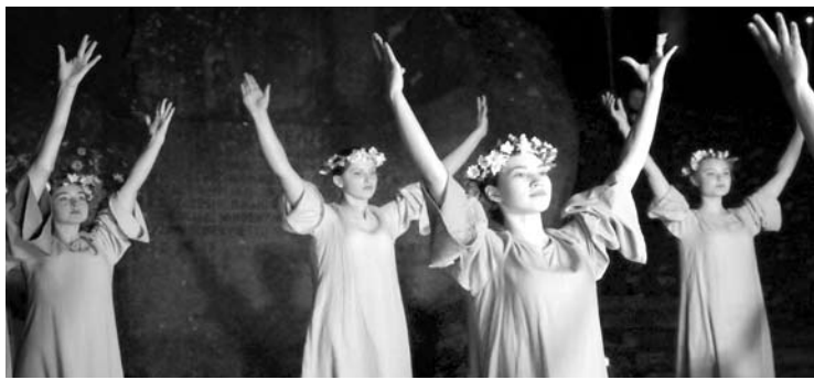
„Teatralizuotoje šviesos ir muzikos saktėje „Atminties skrydis““ dalyvavo Anykščių kultūros centro mėgėjų meno kolektyvai.