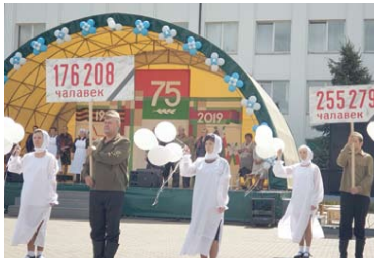
Lentelėse – Baltarusijos rajonų netektys Antrajame pasauliniame kare.