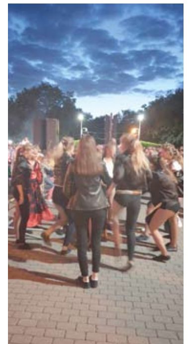
Laukdamas pasirodymo merginos linksmis už scenos. Naujas trendas – džinsai su viena klešne.